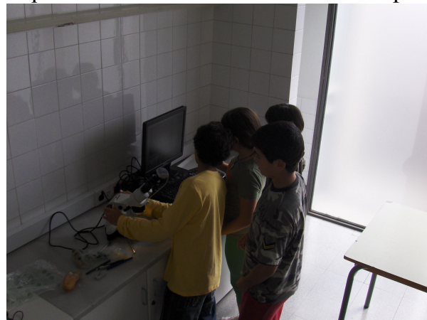
Treball de laboratori