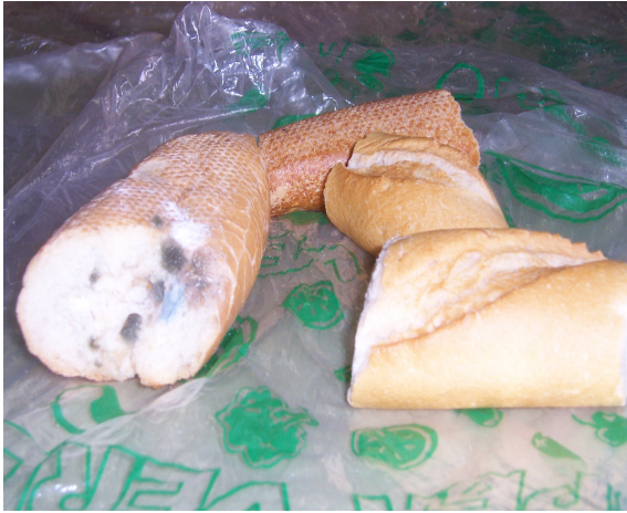
Aquest es el pa amb fongs