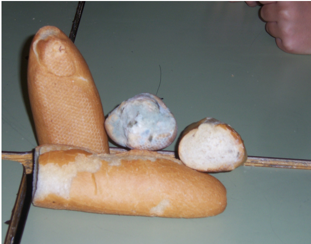
Això va ser quan va passar una setmana després de fer el procés .