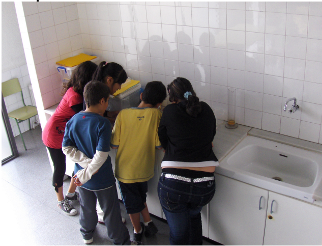
Això som nosaltres posant-li el topionic a la ceba al laboratori.